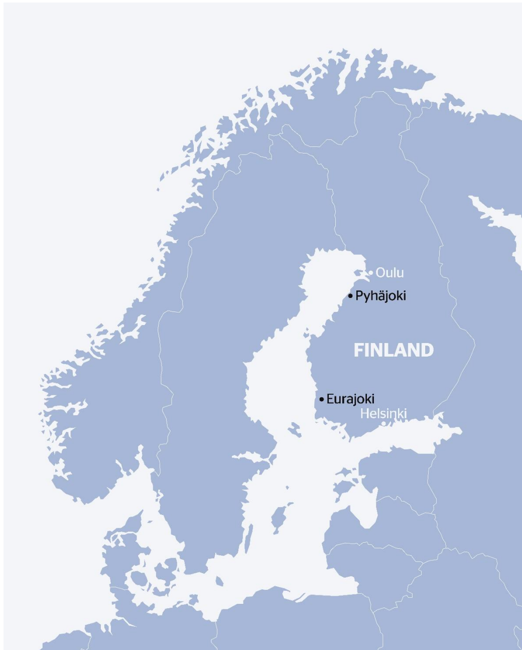
Joonis 3. Asukohad – Pyhäjoki ja Eurajoki.