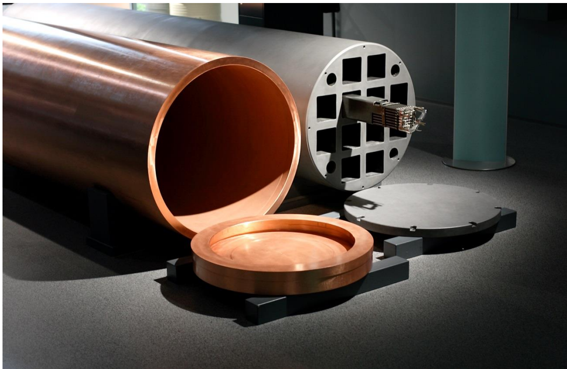
Joonis 2. Ladustuskanistri siseosa ja väliskest. Pildil on Olkiluoto 1 ja 2 jaoks ette nähtud kanister. Selle läbimõõt on 1,05 meetrit ja pikkus 4,8 meetrit. Fennovoima kanistrid on pisut pikemad ja neil on teistsugune siseosa.

Termin „kapseldusjaam“ tähistab tuumarajatist, kus kasutatud tuumkütus pakendatakse ladustuskanistritesse. Ladustuskanister on massiivne metallmahuti, millel on malmsisemus ja vaskümbris (Joonis 2).