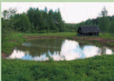
TIIGI TAASTAMINE JA TAASTATUD TIIK