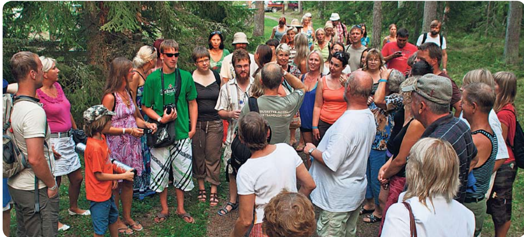
Организуемые Viru Folk фестивали привлекают тысячи людей, которые могут не только насладиться музыкой и прикоснуться к природе, но и научиться сортировать бытовые отходы. Так выглядит образцовый уголок по сбору мусора. На фестивале фолк-музыки посетители избавлялись от мусора с умом.

«Деятели года в сфере окружающей среды 2010» в номинации предложение экологически чистых товаров и услуг признано недоходное объединение Viru Folk за организацию сбора отходов на крупных мероприятиях.