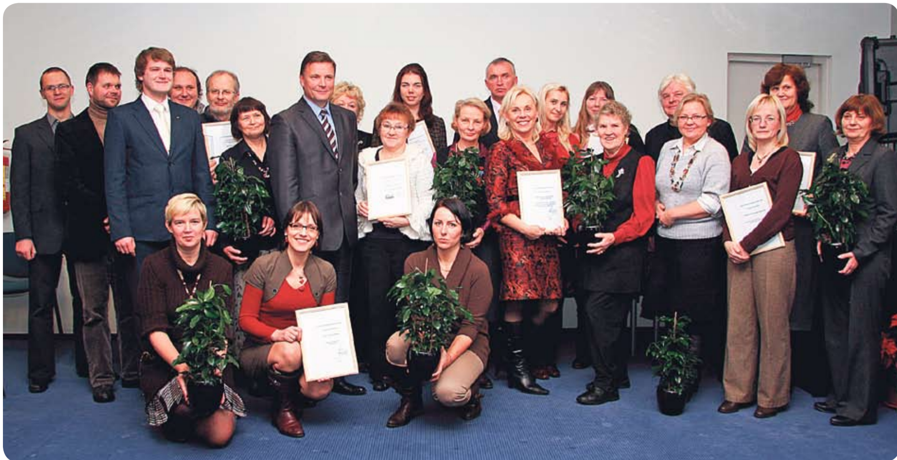
В конкурсе Aasta Keskkonnategu 2010 приняли участие 5 крупных проектов в сфере окружающей среды и 20 небольших проектов, а также 7 отдельных кандидатов. Признания и наград были удостоены 11 из них, но добрые слова похвалы заслужил каждый, кто думает о нашей окружающей среде и трудится на ее благо. После награждения организаторы самых успешных проектов сфотографировались с министром Янусом Тамкиви.

В этом году в конкурсе приняли участие 5 кандидатов с крупными проектами в сфере окружающей среды и 20 — с небольшими. Главная цель проектов — повысить сознательность в области окружающей среды, научить сортировке отходов и объяснить необходимость вторичного пользования, а также привлечь детей и взрослых к превращению своей окружающей среды в более дружелюбную по отношению к природе. Денежные премии (всего 70 000 крон) были распределены между шестью проектами.