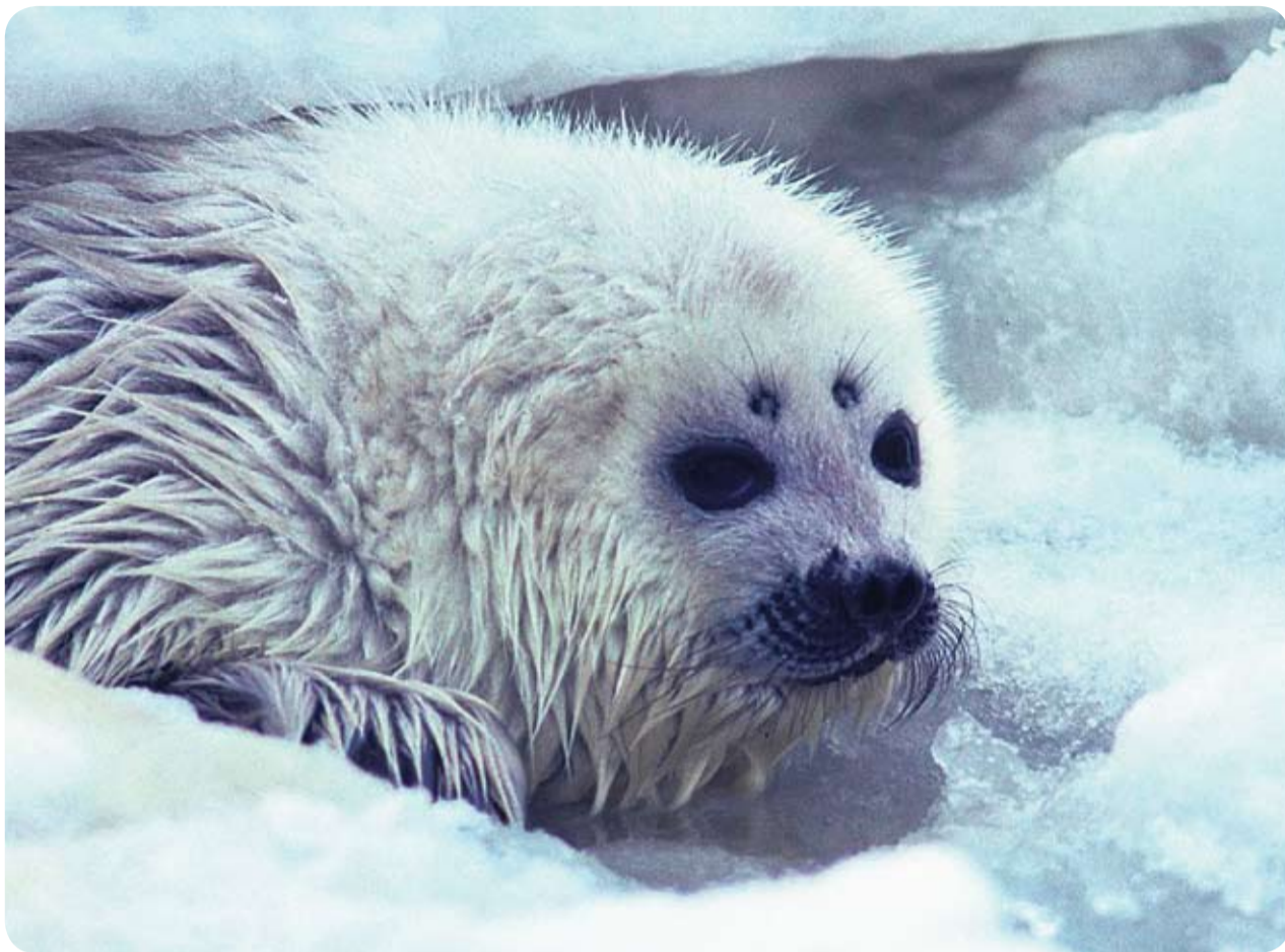
Исконный обитатель Балтийского моря кольчатая нерпа относится к числу охраняемых видов. Детеныш нерпы имеет белый наряд, за что и получил название белек.

Эксперты, занимающиеся проблемами Балтийского моря, единодушно считают одной из самых серьезных про-