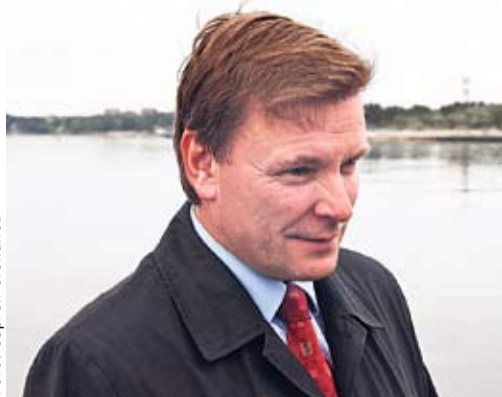
Министр окружающей среды Янус Тамкиви: «Наиболее эффективно организовать защиту моря удастся благодаря сотрудничеству стран региона Балтийского моря».

Хотя сделано уже немало, большая работа предстоит и стране, и каждому предприятию, и каждому жителю. Всем нам следует приложить немало усилий к тому, чтобы очистить Балтийское море от опасных веществ, существенно снизить сбросы азота и фосфора, чтобы восстановить биологическое разнообразие и рыбные запасы. Ведь другого Балтийского моря у нас нет!