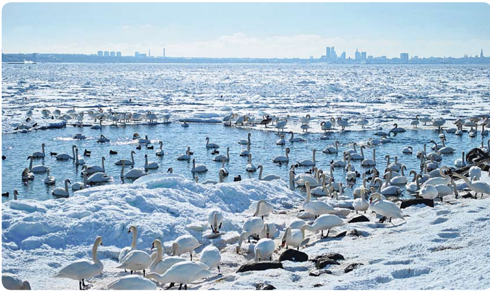
Еще сто лет назад лебеди-шипуны были редкостью в Эстонии. Теперь же они даже на зиму не хотят покидать наше побережье. Этот снимок был сделан прошлой зимой в волости Виймси.