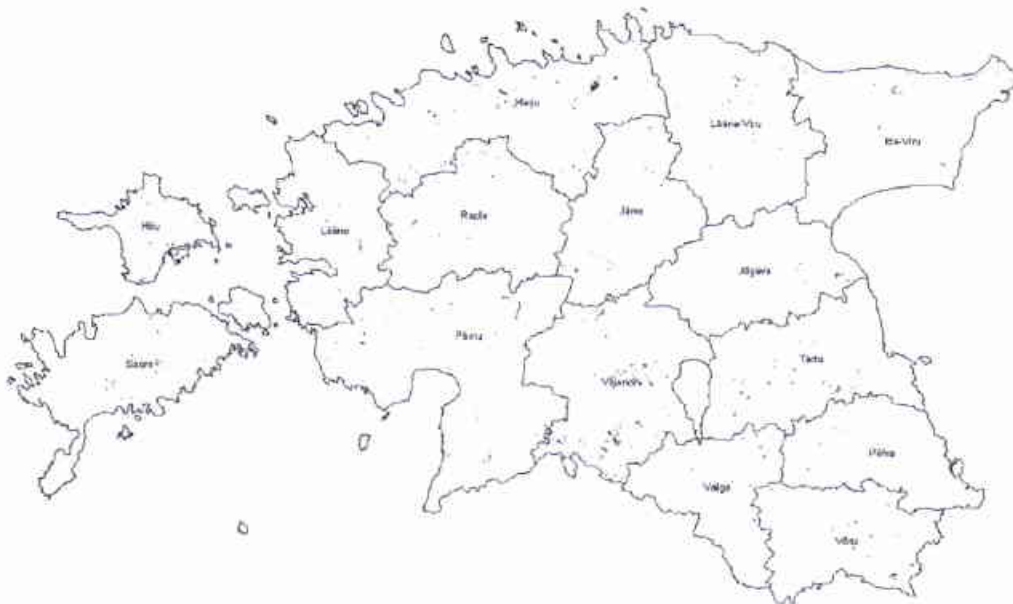
Joonis 1. Karuputke võõrliikide kolooniate paiknemine vastavalt 2003. a inventuurile.

Välitööde tulemuste kohaselt oli karuputke tulnukliikidega kaetud ala suurus Eestis ligikaudu 1470 hektarit. Kolooniaid leidis kõigis maakondades, kuid levikukaarti jälgides võib oletada, et levikut on ilmselt kohati isegi alahinnatud. Mõnes maakonnas esineb kaardil valgeid laike kohtades, kus varem oli karuputke võõrliikide levik dokumenteeritud (Jõgevamaa lääneosas, Raplamaa kaguosas; joonis 1).